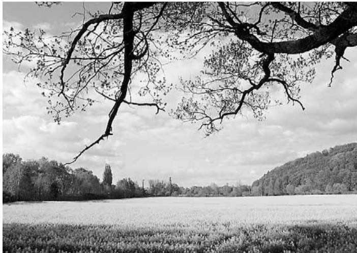
Řepka vytěsnila z polí obilí. Na jaře všude svítí kanárkově žlutá.