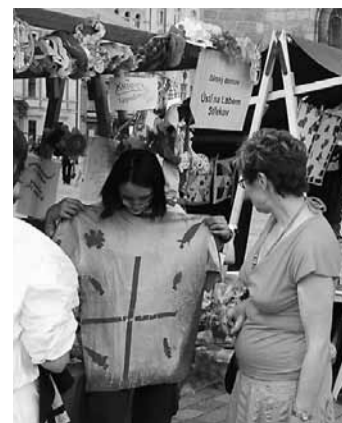
Na jarmarku byl zájem o všechno. A děti z domovů navíc dokázaly zboží jak se patří nabídnout.

Na náměstí Republiky v Plzni se uskutečnil originální jarmark s názvem Jarmark pro šikovné ručičky, který pořádaly děti z dětských domovů Plzeňského kraje ve spolupráci s Nadací Terezy Maxové. Nabídka zboží byla pestrá, originální a mladí prodavači přítomné překvapili ochotou a rafinovanými marketingovými triky. Netradičně zdobená trička, módní oděvní doplňky a ozdoby, obrázky z netradičních materiálů, keramika, drobnosti, věci praktické i pro radost vyrobené dětmi z dětských domovů, to vše za mimořádné ceny. „Bylo to úžasné a super,“ prozradila návštěvnice jarmarku Jitka Kubíková a přidala se i další, kteří nešetřili superlativy. Plzeňský kraj od roku 2001 zřizuje na svém území 7 dětských domovů celkem pro 290 dětí, které ve většině zařízení nežijí pouze v jedné budově, ale i v bytech a domcích v běžné