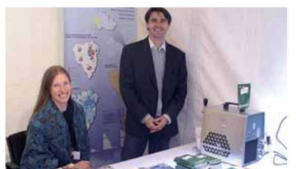
Na akci se prezentoval také Plzeňský kraj se svým stánkem.