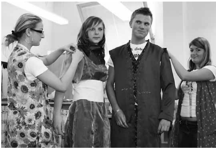
Kostýmy navrhovali a šili studenti Integrované střední školy živnostenské v Plzni. Sami je také před dokončením zkoušeli a jejich kolegové si zase vzali na starost drobné dodělávky.