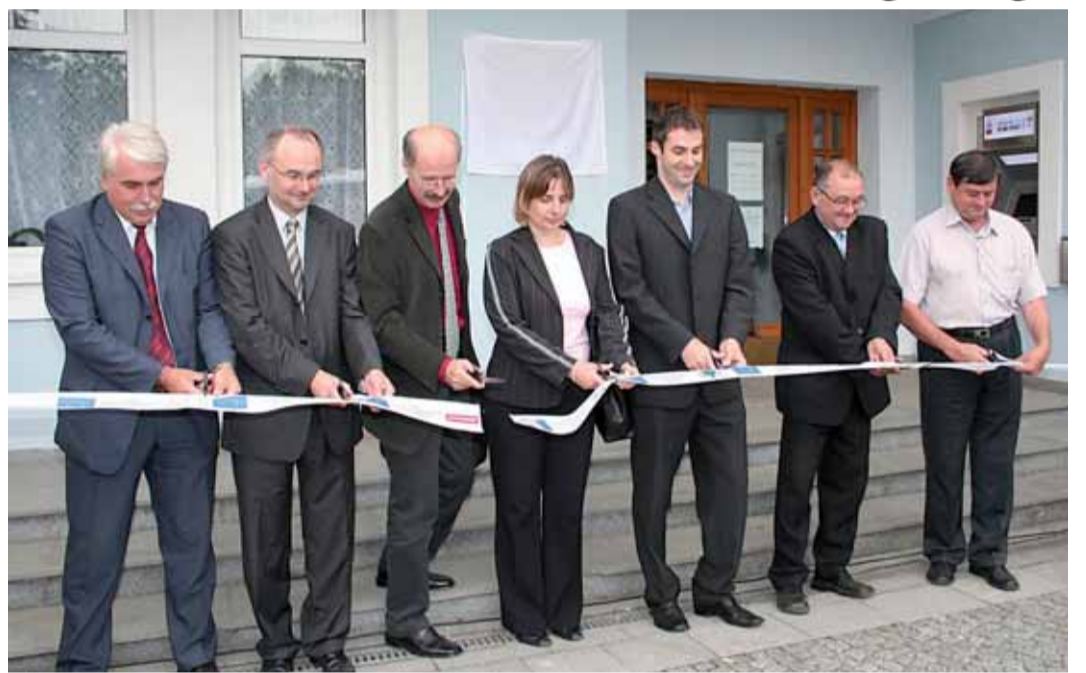
Projekt je ukončen! Slavnostní pásku přestříhli představitelé ministerstev, kraje, mikroregionu Radbuza a dodavatelských firem.