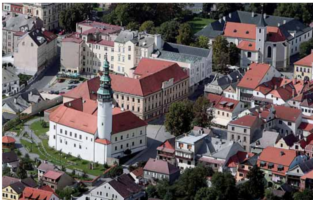
V dnešní fotohádance je vaším úkolem poznat, jaký objekt je na leteckém snímku. Odpovědi zasílejte s vaší zprávnou adresou do redakce měsíčníku Plzeňský kraj, Husova 29, 301 00 Plzeň.