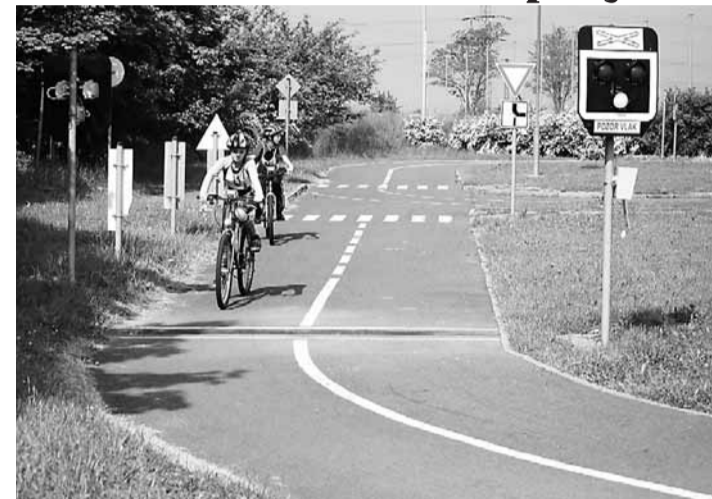
Novinkou letošní soutěže byl plně funkční železniční přejezd na dopravním hřišti.

Do krajského finále postoupili vítězové 7 okresních kol v obou kategoriích. Jednotlivá družstva měla po 4 členech. Vítězná družstva v obou kategoriích postoupila do celostátního finále v Praze