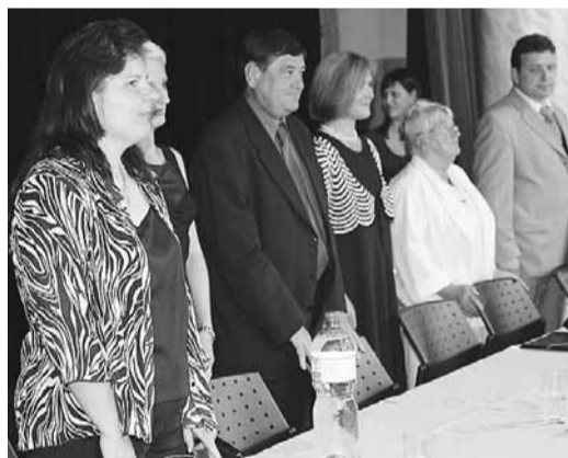
Ze slavnostního vyřazení absolventů Střední zdravotnické školy v Plzni.

kraje pro oblast školství, mládeže a sportu Václav Červený. „Velmi rádi vidíme, když se škola zviditelní v očích veřejnosti a pochlubí se svými úspěchy, jak se to podařilo Střední zdravotnické škole a Vyšší odborné škole zdravotnické Plzeň. Na závěrečném vyřazení maturantů v Mě-