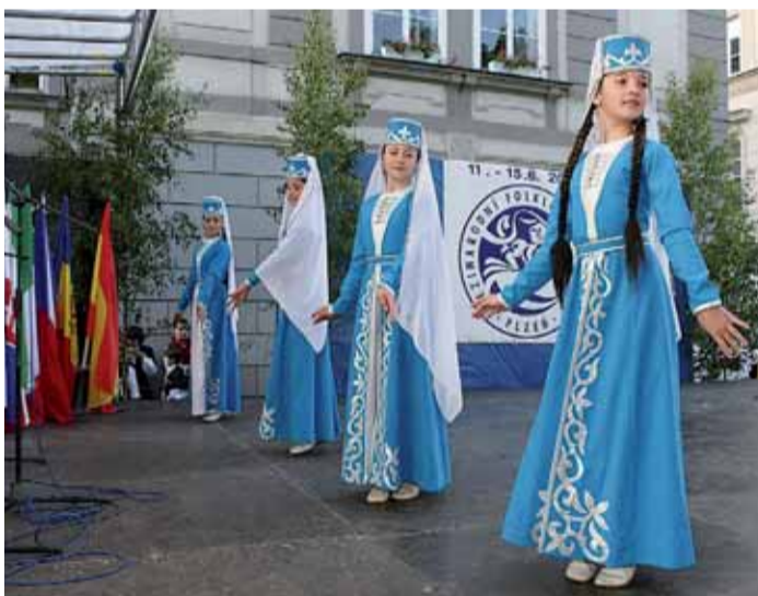
Na festivalu se představilo také dětské taneční studio Suna z města Slepovál z Ingušské republiky. Soubor má ve svém repertoáru lidové tance z Kavkazu.

Nad letošním Mezinárodním folklorním festivalem v Plzni, který je od roku 1997 místem setkávání milovníků folkloru a lidového umění, převzal záštitu hejtmán Plzeňského kraje Petr Zimmermann. Představitel Plzeňského kraje si uvědomují i nemalý význam Mezinárodního folklorního festivalu v Plzni pro rozvoj cestovního ruchu. „Toho dobrého je hodně: ví se o nás ve světě, ti, kteří přijedou k nám ukázat své umění, se určitě rádi v myšlenkách vracejí