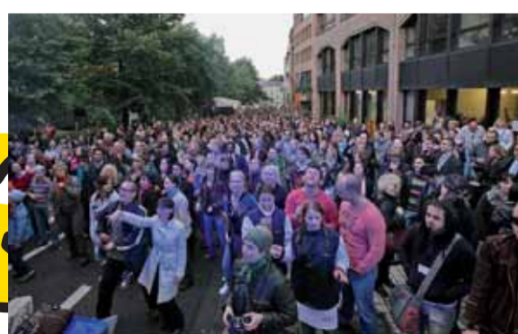
Na street party se v Bruselu přišly podívat stovky lidí.