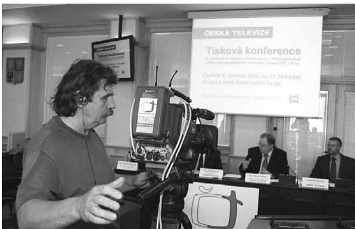
Tiskovou konferenci o digitálním vysílání na Plzeňsku, která se konala na Krajském úřadě PK, vysílala Česká televize v přímém přenosu na ČT24.

K piktoqramu se bude na ČT2 z Krkavce průběžně přidávat také informační lišta, která upozorní textem na blížící se vypnutí analogového zemského vysílání 2