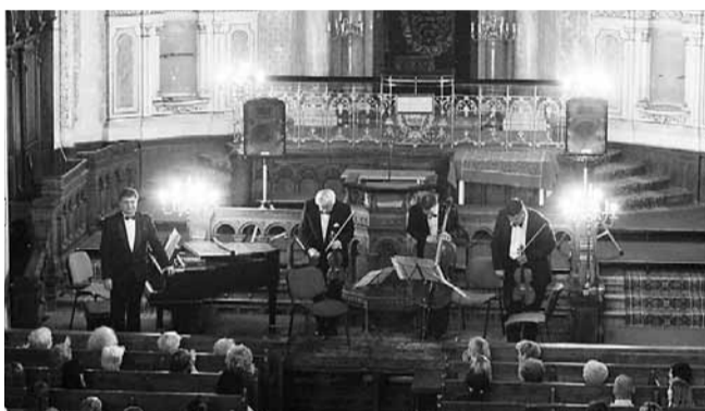
Vystoupení ve Velké synagoze v Plzni.

Od roku 2003 Plzeňský kraj finančně podporuje cyklus koncertů „Hudba v synagogách plzeňského regionu“. Stěžejní součástí cyklu jsou benefiční koncerty v místech úzce svázaných s židovskou tradicí a kulturou – synago-