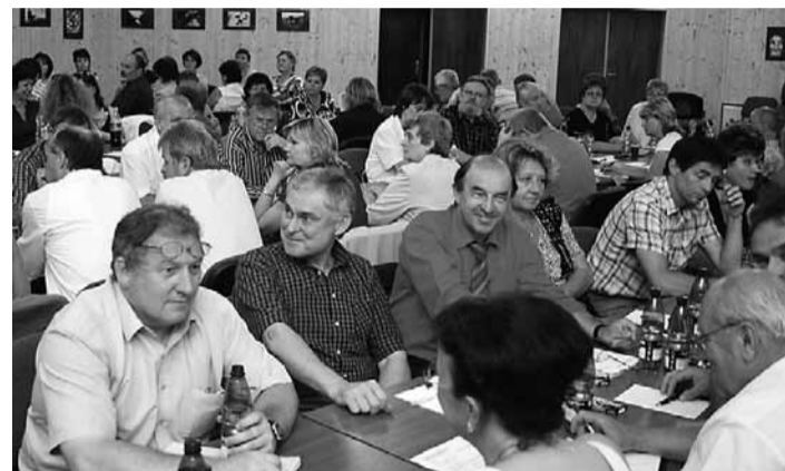
Porada ředitelů škol se uskutečnila ve Střední průmyslové škole dopravní v Plzni.

Operačního programu Životní prostředí a Regionálního operačního programu pro NUTS II Jihozápad. „Kraj pomáhá realizátorům těchto projektů především zajištěním prostředků na jejich spolufinancování,“ dodal 1. náměstětek hejtmána. Samostatnou kapitolou budou globální granty Plzeňského kraje v rámci Operačního programu Vzdělávání pro konkurenceschopnost. Prostředky neinvestičního charakteru jsou určeny na zlepšování kvality a dostupnosti vzdělávání ve školách, ale i mimo ně. V závěru porady se 1. náměstětek hejtmána Červený rozloučil s řediteli škol a školských organizací, kteří letos končí, a přivítal jejich nástupce. (RED)