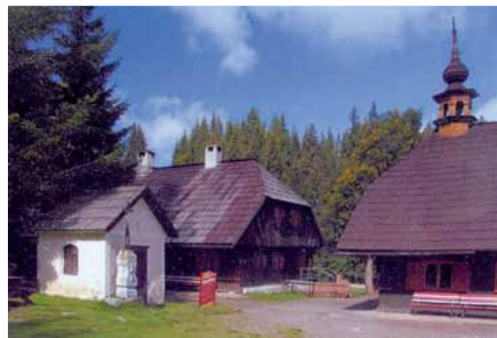
Antýgl – bývalý královský dvorec

Tipem na prázdninový výlet může být údolí řeky Vydry na Šumavě. Kaňonovitě údolí nejkrásnější šumavské horské říčky s peřejnatým řečištěm, obřimi hrnci vymletými v žulových balvanec patří k nejatraktivnějším turistickým cílům Šumavského národního parku. Výchozím bodem výletu je původně dřevařská osada Srní. Centrum obce s řadou penzionů a hotelů je orientováno kolem kostela Nejsvětější Trojice, přičemž řada domů představuje zdejší lidovou architekturu. Do povědomí lidí se dostala rozložitá chalupa čp. 46, která představovala hájovnu v legendárních filmech s Tomášem Holým Pod Jezeví skálou, Na pytlácké stezce a Za trnkovým keřem. Po žluté značce se lze dostat do osady Dolní Hrádky, kousek nad malebně upraveným penzionem od rozcestí Horní Hrádky nalezneme hotel Kamenný dům, přestavěný hostinec z Klostermannova románu. Za posledními samotami ve svažujícím se údolí nás žluté značení dovede k bývalé Hálkové chatě, která byla před rokem 1938 jedinou českou chatou v Po-vydrí. Na protějším břehu Vyd-