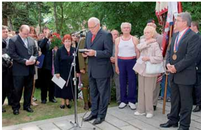
Prezident republiky Václav Klaus byl hlavním hostem slavnostního aktu odhalení pomníku E. Beneše v Kožlanech.

V sobotu 24. května byl v Kožlanech odhalen pomník prezidentu Edvardu Benešovi. Tento slavný kožlanský rodák byl spoluzakladatelem Československé republiky a významným evropským politikem své doby.