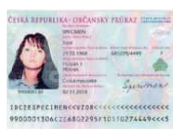
OP se strojově čitelnými údaji