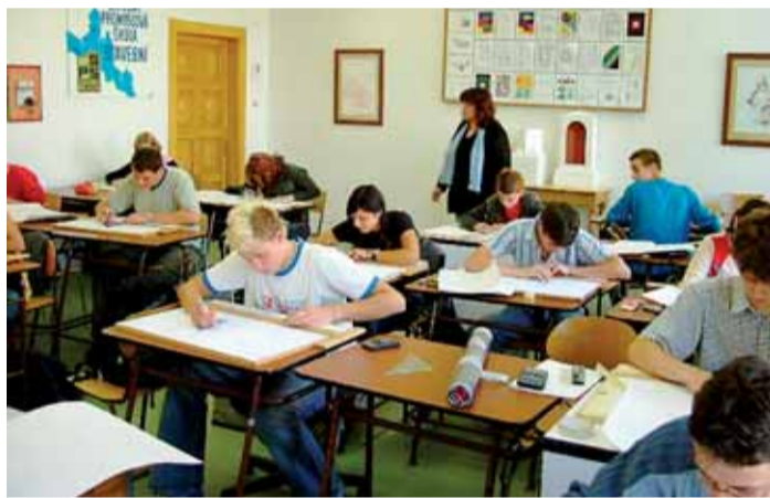
Učebna rýsování na Střední průmyslové škole stavební v Plzni.

Zákon zde stanovuje částečně odlišné podmínky. Termín přijímací zkoušky, kritéria přijímání a počet přijímaných žáků již měli zveřejnit ředitelé škol do 30. říj-