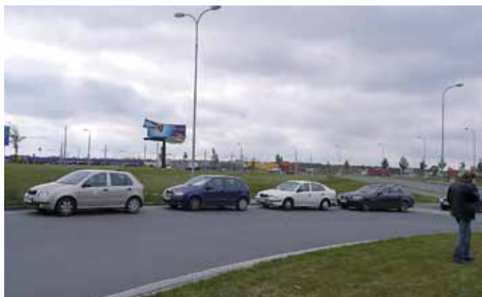
Směr u okružní křižovatky U Nové Hospody, kterým povede 0. etapa.

Celková částka vydaná na stavbu dosáhne výše 163,4 mil. Kč.