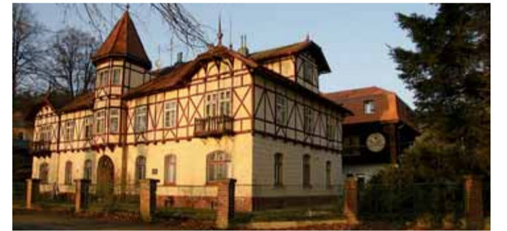
Historická budova Domova klidného stáří v Žinkovech.

Celá investiční akce je rozdělena do dvou částí – na výstavbu nového pavilonu a opravu hlavního objektu DKS. Ta je z mého pohledu nevyhnutelná. Budova byla postavena v roce 1900 a technická úroveň a kvalita odpovídá jejímu stáří. Kompletní rekonstrukce se týká nejen bytovací části pro klienty, ale i technického zázemí a administrativní části. Právě v těchto dnech začínají v našem areálu demoliční a terénní práce a začne se s výstavbou nového pavilonu. Na tu v druhé polovině roku 2009 naváže rekonstrukce hlavní budovy. V tu dobu již budou naši klienti přestěhováni do nového. Také ad-