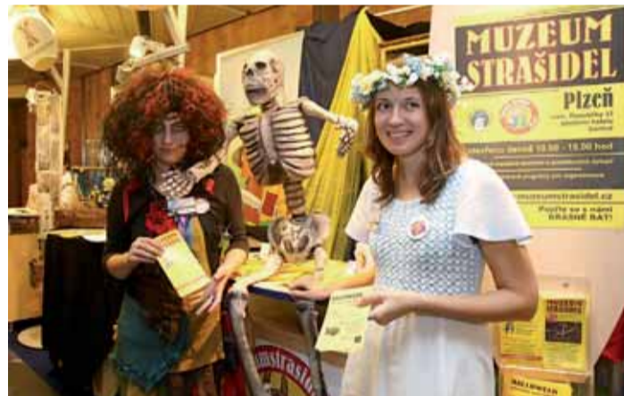
Prezentace Muzea strašidel na veletrhu ITEP.

„Široká veřejnost měla samozřejmě na veletrhu ITEP 2008 opět vstup zdarma a tentokrát každý návštěvník jako dárek dostal mimo jiné malého keramického šnečka, který je výsledkem aktivit lidí s mentálním postižením ze středis-