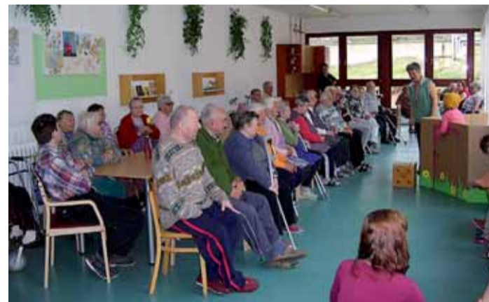
Klienti DKS Žinkovy při dětském divadelním vystoupení.

Technický stav hlavní budovy je nevyhovující. Nemáme zde výtah. Téměř všude, kam se podíváte, něco „hoří“. Pokoje jsou sice rozlohou velké, nemají však samostatné sociální zařízení. Máme pouze jednu společnou koupelnu a takto bych bohužel mohl pokračovat dále... Od rekonstrukce a stavby nového pavilonu si slibujeme zlepšení podmínek pro uživatele i zaměstnance. Klienti budou bydlet v jedno- či dvoulůžkových pokojích. V obou budovách vzniknou výtahy. Snad jen výtah zmíním další prostory, které budeme využívat: ordinace lékaře, rehabilitace, sesterny, prostornější šatny, kanceláře, zasedací místnost, kuchyňky, kadeřnictví či zbrusu nová prádelna. Vše samozřejmě bezbariérově. (BOS)