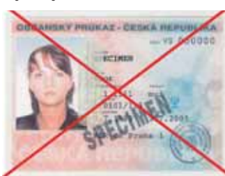
OP bez strojově čitelných údajů

Krajský úřad Plzeňského kraje upozorňuje na konec platnosti občanských průkazů bez strojově čitelných údajů vydaných do 31. 12. 2003.