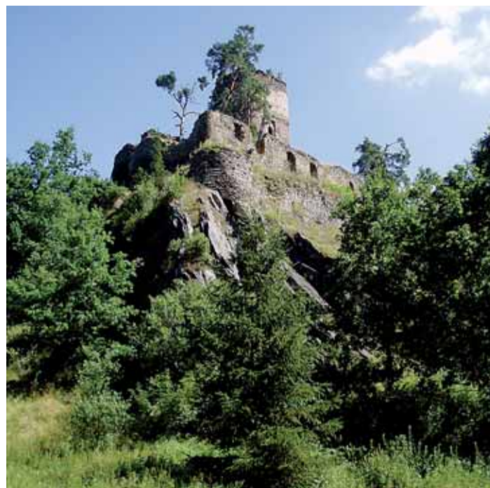
Zřícenina hradu Gutštejn

Po důkladné prohlídce památek sestoupíme stále po žluté trase pěšinou až k potoku Hadovka.