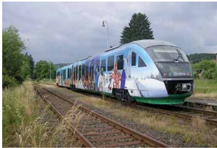
Nové vozidlo DESIRO, které by se již brzy mohlo objevit na trase Plzeň–Domažlice.

Představitelé Plzeňského kraje si uvědomují, jak důležité je mít