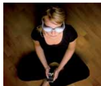
Slečna právě používá nejnovější psychowalkman LAXMAN.