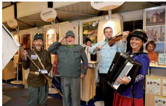
Divadlo Pluto a Kubišta Švejč.