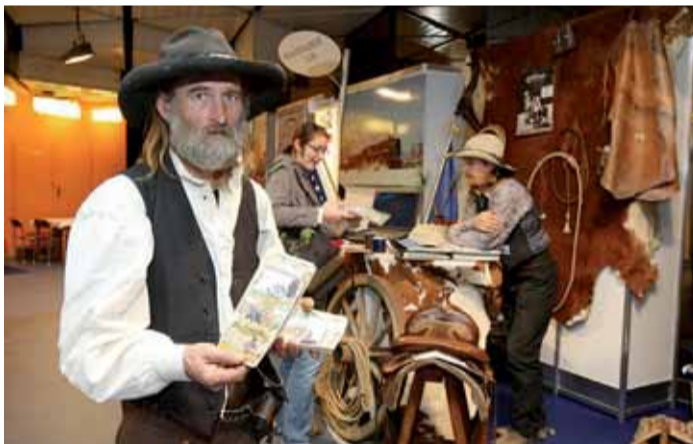
Na veletrhu cestovního ruchu ITEP bylo místo i pro western.

Každý veletržní den byl vylosován jeden návštěvník, který byl odměněn dárkovým pobytovým poukazem věnovaným vedením luxusních plzeňských hotelů An-