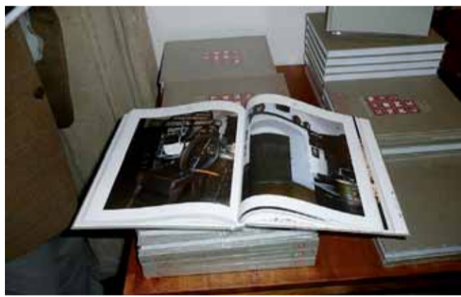
Ukázka z knihy Paměť PK při její prezentaci v ZČM.

Každé organizaci a jejím pobočkám je v knize věnována samostatná kapitola s přehledným členěním. Publikace nabídne čtenářům nejen základní informace o zmiňovaných kulturních institucích, ale i o jejich širší historii, současném vývoji a významných expozicích. Díky knize bude možno získat detailní informace např. o sbírce militarií Západočeského muzea, o sbírce skla v Muzeu Šumavy, či o expozici Chodská svatba Muzea Chodská. Prostor je v knize Paměť Plzeňského kraje vyhrazen i zvláštnostem, jako je Santiniho oltář v Mariánské Týnici. Velká pozornost je věnována také objektům, v nichž organizace sídlí a které mají často charakter architektonicky unikátních či hodnotných staveb. Jedná se například o zámek Hradiště v Blovicích a proboštství v Mariánské Týnici. Svě místo v knize mají také informace o vnitřním členění